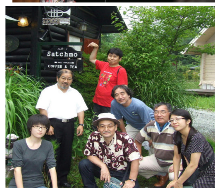
横内ジュニアジャズ(下) 三絃の飛び入りがありました。茶色の小瓶がよかったです。