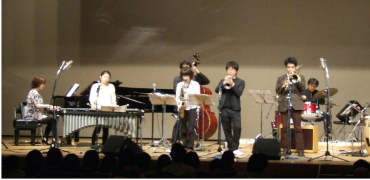
明るいポップなジャズ演奏のリメンバース