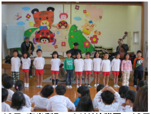
19日:奈半利町 なはり幼稚園