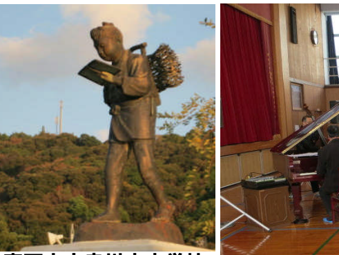
19日:室戸市吉良川小中学校