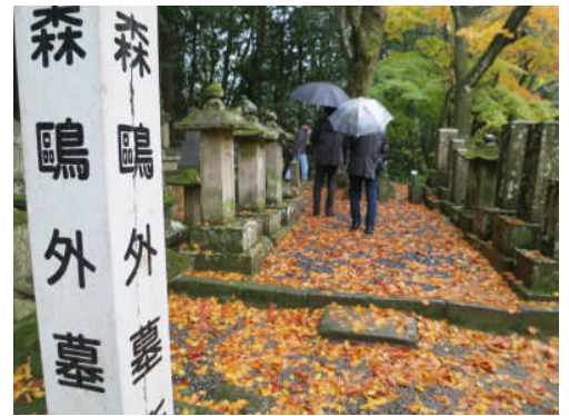
15日:津和野 永明寺 鷗外の墓