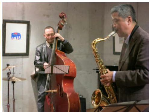
13日:下松 華のうつわ ギャラリーカフェ