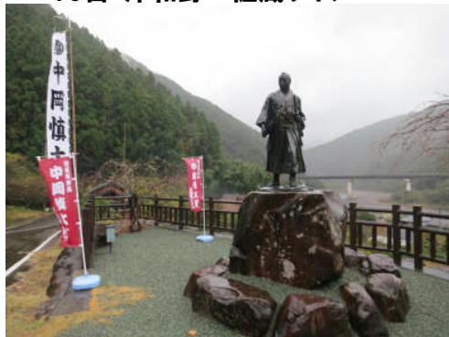
17日:高知 北川村 大雨の中、中岡慎太郎生家で命日の記念演奏