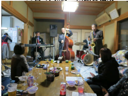
16日:高知安田町 民家カフェ(普通の座敷です)