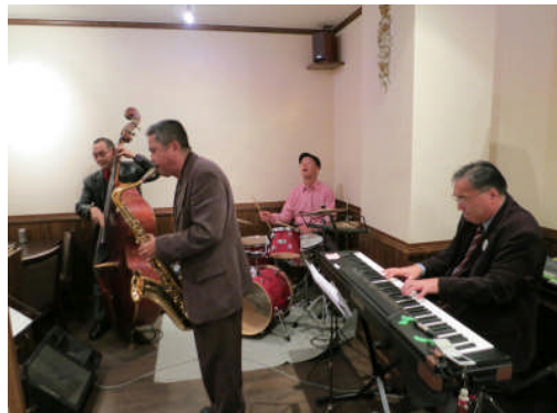
10日:隼人 停車場(隼人駅のとなり)