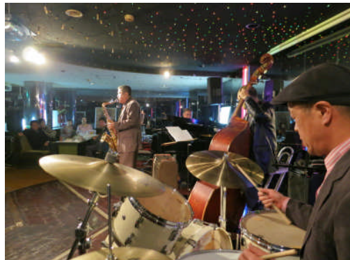
8日:都城ドルシー 懐かしいクラブの雰囲気