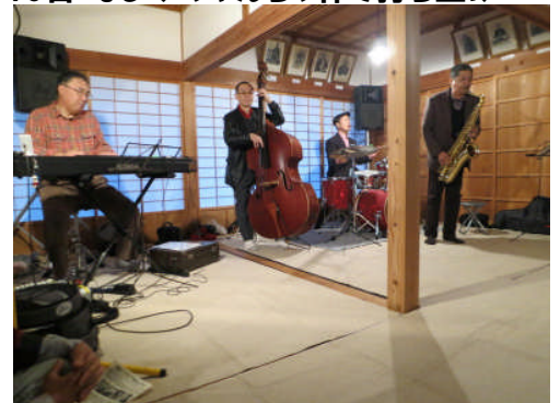
17日:北川村 モネの庭 デイナーコンサート