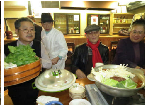
15日:なじみのやんちゃ林で打ち上げ