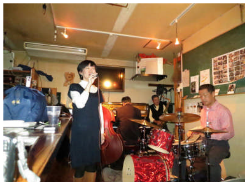
12日:鹿児島天文館 吉次郎 アットホームでいて結構真剣になる場所です