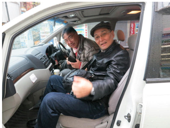
6日:小雨まじりの出発