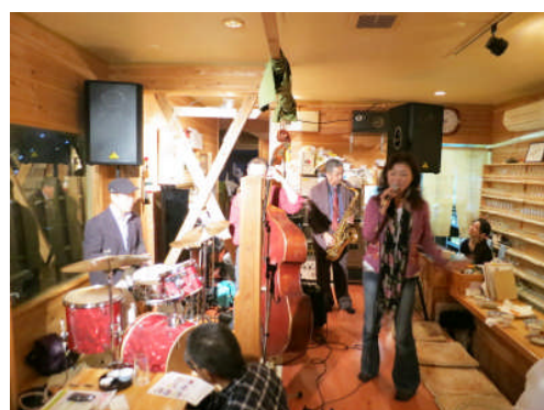
11日:鹿屋市 水車の茶屋