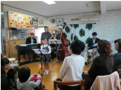
11日:鹿児島ホームコンサート