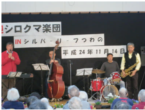
14日:津和野 シルバーリーフつわの