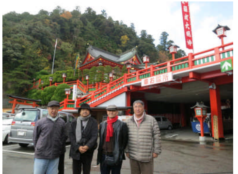
15日:津和野 太鼓谷稲成