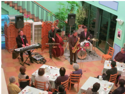
17日:北川村 モネの庭 デイナーコンサート