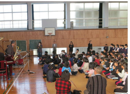
19日:室戸市吉良川小中学校

なはり幼稚園は年に2回も行くのもうなじみです。吉良川小中は小中併せてたしか100名くらいの学校だったと思います。保護者の方も来られて和気あいあいと楽しいコンサートになりました。