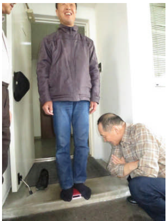
7日:日課は体重測定です