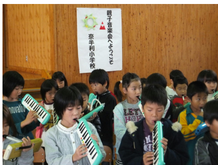
12月1日木曜日 1040~奈半利小学校「親子音楽会」参加