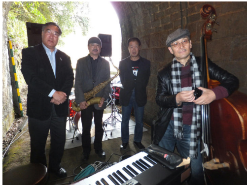
午後は中芸地区をかつて走っていた森林鉄道のトンネルで演奏です。

奈半利町の西側に田野町があってその西側が安田町です。どこも車で数分かからないで横断できるくらい小さな町です。まとめて中芸地区と言ったりするようです。今回は幼稚園と小学校が中心でしたので「まるまるもりもり」などとても好評でした。ここでは保護者や地域の方も多く集まって下さいました。